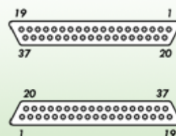
Расположение контактов (2 × 37-pin D-SUB)